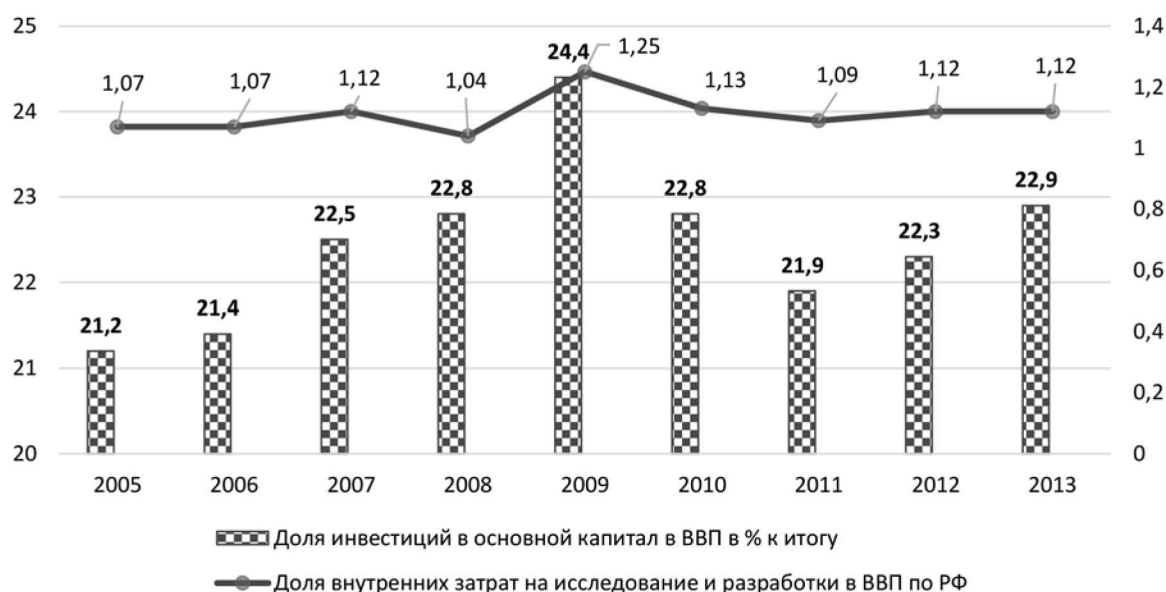
Рис. 2. Динамика инвестиций в основной капитал в ВВП и доли внутренних затрат на исследования и разработки в РФ в 2005–2014 гг. (в % к предыдущему году)

Как видно из рис. 2, на 2009 г. приходится максимальная доля инвестиций в основной капитал в ВВП 24,4 %, а максимальная доля внутренних затрат на исследования и разработки в ВВП составила 1,25 %. Однако необходимо учитывать, что положительную динамику инвестиций в основной капитал создают сырьевые сектора отечественной экономики, т. к. на долю топливно-энергетического комплекса приходится свыше 67 % инвестиций, а на сырьевой комплекс – порядка 18 % инвестиций в основной капитал. Кроме того, именно в данных секторах присутствие государственных компаний максимально, что задает динамику развития всего промышленного сектора страны, поскольку первые 50 компаний с государственным участием определяют от 35–50 % объема промышленного производства России [4].