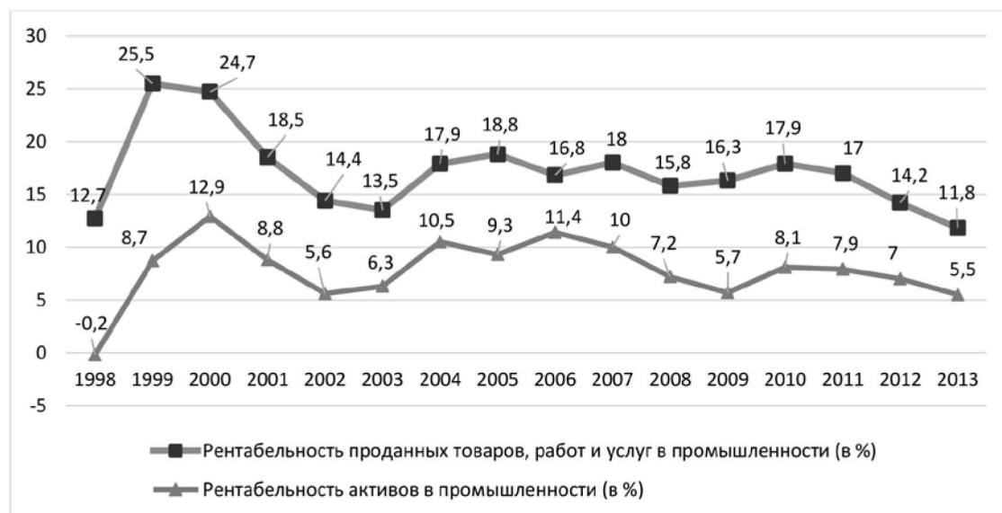
Рис. 4. Динамика рентабельности промышленных предприятий РФ в 1998–2013 гг. (в %)

Приведенный анализ базовых тенденций развития промышленного сектора российской экономики подтверждает необходимость скорейшей реализации комплекса различных инструментов: правовых, экономических, организационных, информационных, налоговых, таможенных, социально-инфраструктурных мер государственного воздействия на промышленную динамику, заложенных в ФЗ «О промышленной политике в РФ, направленных на развитие промышленного и технологического потенциала РФ, реализацию структурной модернизации промышленного развития российской экономики для производства конкурентоспособной продукции.